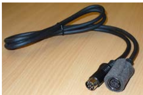
Bilderna ovan visar olika kopplings-scheman för IPOD-interfacet. På den vänstra bilden är Corvetten utrustad med XM-receiver (satellitradio) eller inte. Till vänster den kabel som är medskickad för Corvetter som inte har fördraget kablage för satellitradio (t ex Europaversion).

generellt begrepp för bärbar musik- eller mediaspelare.