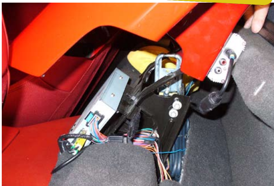
På C6 modellen kan man med fördel montera elektronikboxen bakom "waterfallkåpan" mellan framstolarna på cabrioletmodellen. Till vänster syns XM-receivern och till höger IPOD-interfacet. Bilen på bilden är Conny's C6 cab.

En sådan sak gäller väl IPOD. Vad är då en IPOD? Wikipedia beskriver IPOD som en serie bärbara mediaspelare som tillverkas av Apple Inc sedan år 2001. Ipod har allt oftare använts som